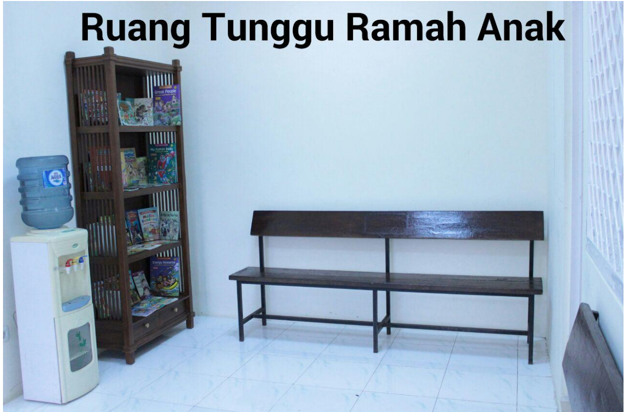
RUANG TUNGGU RAMAH ANAK