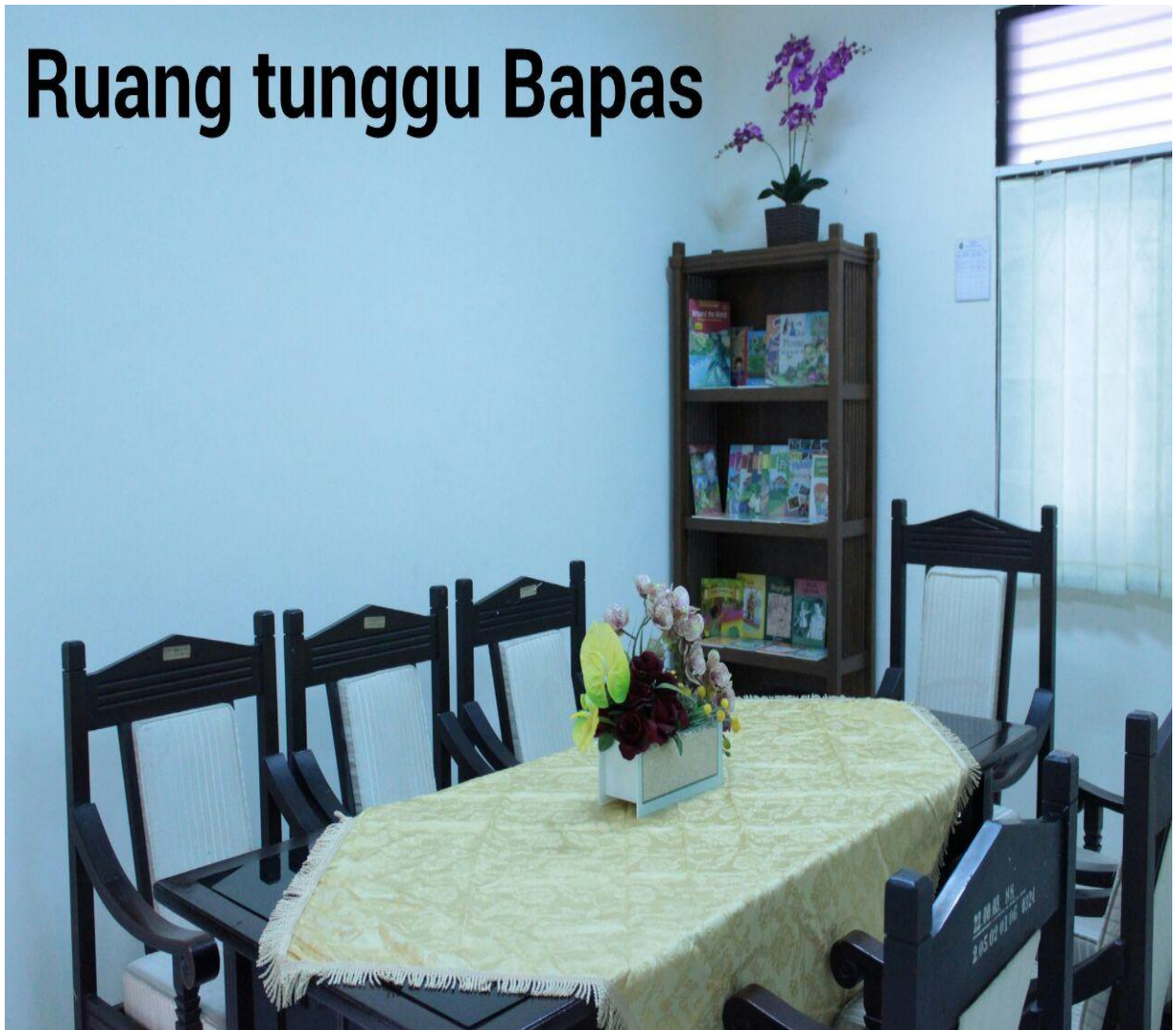
RUANG TUNGGU PK. BAPAS, PENASIHAT HUKUM DAN PEKERJA SOSIAL