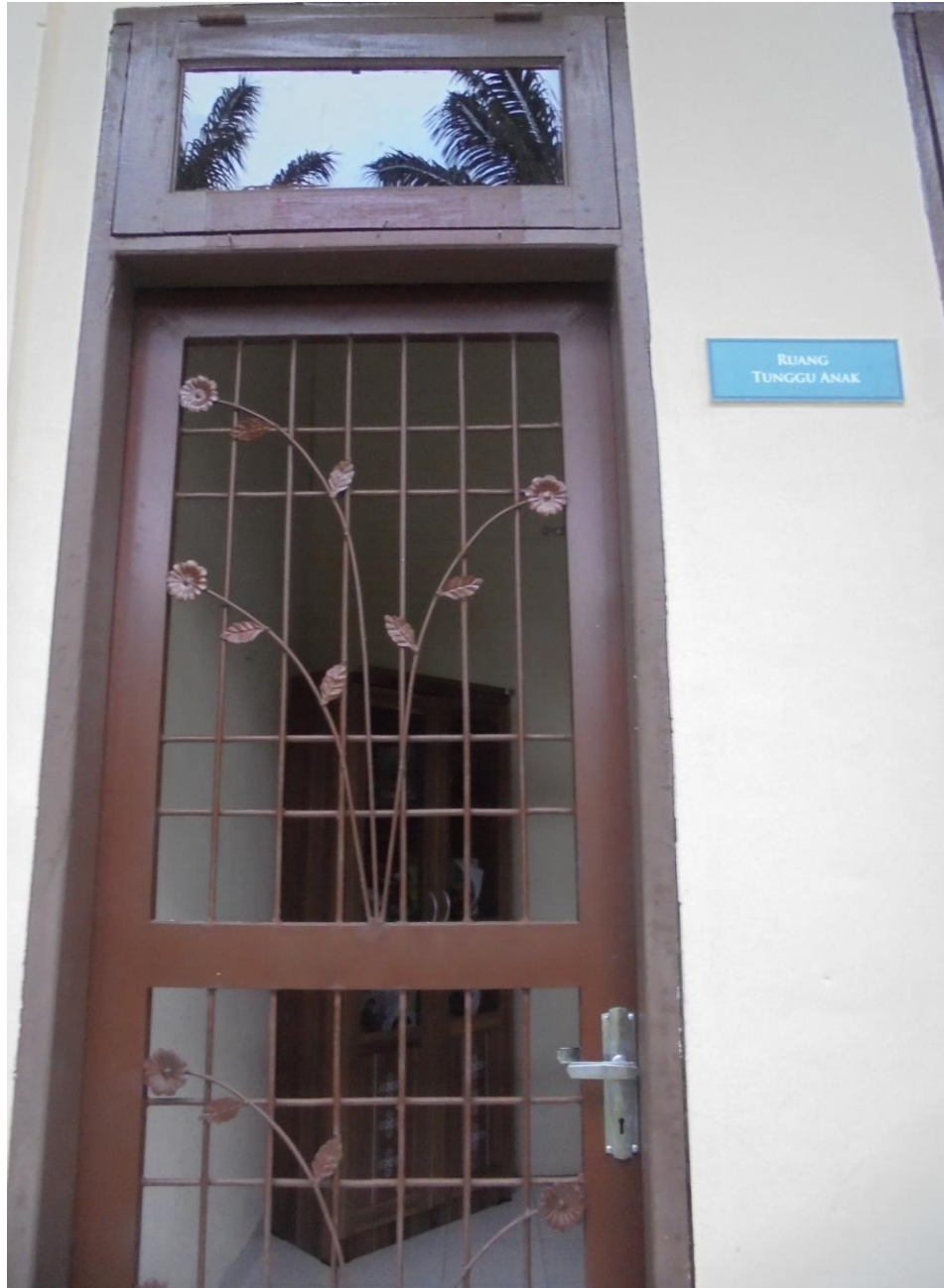
RUANG TUNGGU RAMAH ANAK