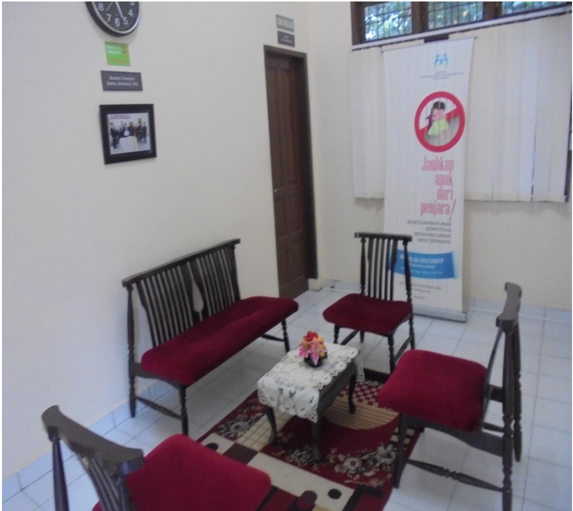
RUANG TUNGGU PK. BAPAS, PENASIHAT HUKUM DAN PEKERJA SOSIAL