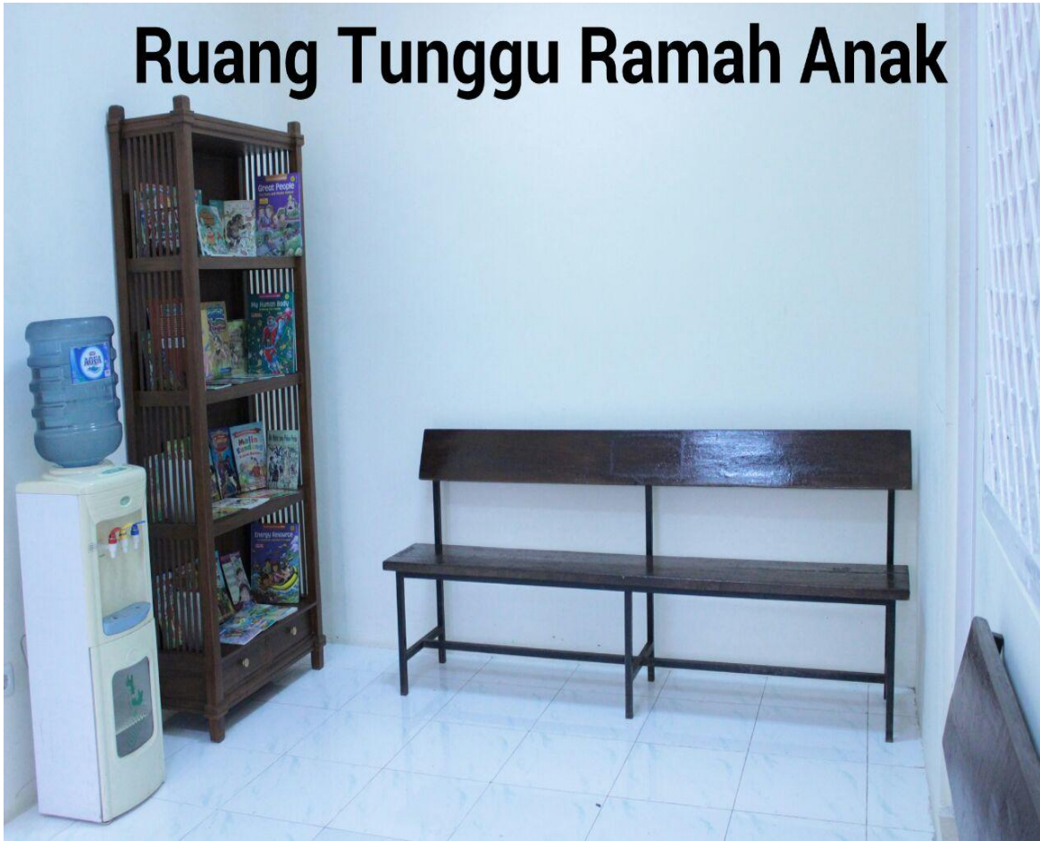
RUANG TUNGGU RAMAH ANAK