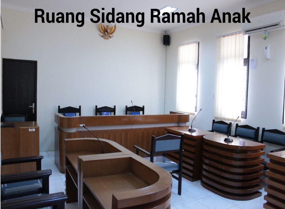
RUANG SIDANG RAMAH ANAK