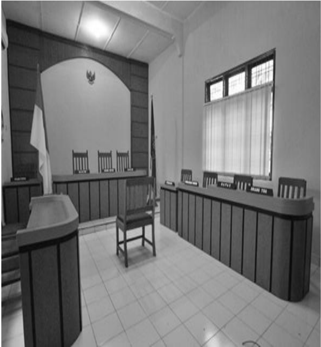
RUANG SIDANG RAMAH ANAK