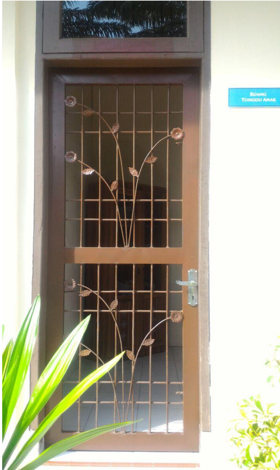
PINTU RUANG TUNGGU RAMAH ANAK